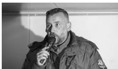
Ο ηγετης του Pegida, Lutz Bachmann, πριν και μετα την μεταμφιεση του στο προσφιλες του ινδαλαμα...

Στην πρωτη εισημη δυναμικη εμφανιση τους, τον περασμενο οκτωβρη στην κολωνια σαν HOGESA (Χουλιγκανοι εναντια στους σαλαφιστες) με 5.000 συμμετεχοντες, πταν ενδιαφερον οτι η αντιφασιστικη αντιδιαδηλωση ειχε μονο 300-500 ατομα, παρολη την ειλικρινη προσπαθεια των γερμανων αντιφασιστων να γλειψουν τον αγανακτισμενο οχλο. Οι αντιφασιστες καλουσαν με τιλο «εναντια στο ρασιζμο και τον θρησκευτικο φονταμενταλισμο» (αντιφα κολωνιας). Κατα συνεπεια, οσοι συμφωνουσαν με το δευτερο σκελος του καλεσματος τους, προτιμησαν το γνησιο απο το αντιγραφο. Για να το ξεκαθαρισουμε: Το να είναι ενα ατομο εναντια στο θρησκευτικο φανατισμο είναι ενα ζητημα αντιληψεων η αξιων. Αν είναι μαλιστα και ειλικρινες, είναι ενα αξιοπρεπες ζητημα. Το να το κανει ομως αυτο καλεσμα εναντια σε νεοναζι είναι ζητημα απδιας και μονο.