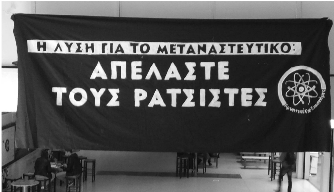
Πανό από τις Αρνητικές Επιστήμες, στη Σχολή Θετικών Επιστημών στην Αθήνα - https://arnitikesepistimes.wordpress.com/ Επιτέλους το ελληνικό πανεπιστήμιο παράγει απόψεις χρήσιμες για την κοινωνία.